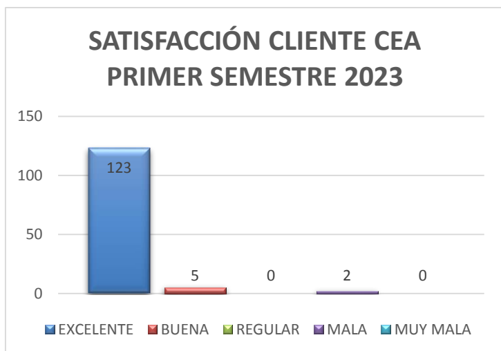
Tabla 01. Atributo/Característica Evaluada