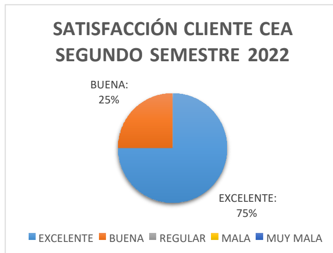
Grafica 01. Análisis de Satisfacción del Cliente

Del análisis anterior se obtiene un resultado de los 15 usuarios del Centro de Enseñanza Automovilística a los cuales se les aplico la encuesta el 75% representa una satisfacción excelente y el 25% una satisfacción Buena, de las 12 Preguntas realizadas bajo los siguientes parámetros.